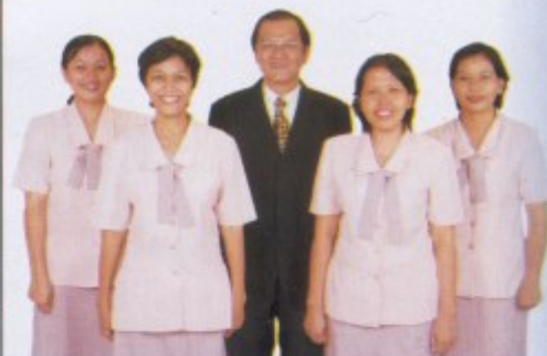
Dokter dan tim

Micrograft Laser Technology adalah Transplantasi rambut dengan menggunakan LASER. Merupakan metode yang paling terkenal dari semua metode yang ada dalam transplantasi rambut. Sejak tahun 1989, metode ini telah digunakan oleh Transhair Institute yang merupakan institut yang terbesar dan paling berpengalaman dalam bidang Transplantasi rambut di Eropa.